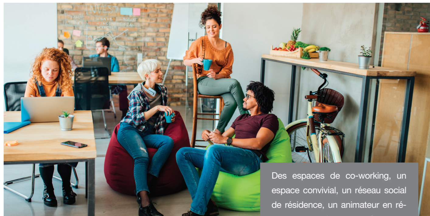
Des espaces de co-working, un espace convivial, un réseau social de résidence, un animateur en résidence pour faciliter les échanges entre tuteurs et tutorés.

L'architecture et l'organisation de la résidence pour la réussite contribuent à développer une vie sociale partagée qui s'appuie sur une animation de qualité. Cette animation est conçue et réalisée par la coordinatrice de la résidence avec une participation active des étudiants de la résidence pour la réussite et en lien avec les autres étudiants et les différents partenaires du projet.